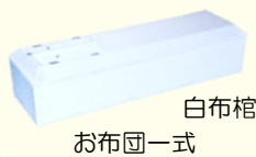
白布棺 お布団一式