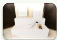
後飾り祭壇セット 16,500円