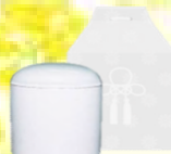
骨壺セット (桐箱・覆い付き)