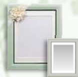
遺影写真セット 16,500円